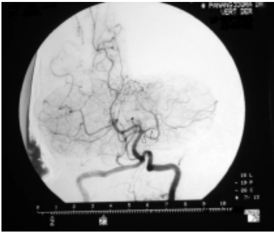
Figura 2. Panangiografía cerebral de un paciente de 14 años de edad. Se observa amputación en la circulación de la arteria cerebral posterior izquierda.

Durante las visitas de control en consulta externa, se encontró persistencia de la hemianopsia homónima derecha, aunque no se detectaron dificultades para leer, escribir o en el aprendizaje. Además, se documentó síndrome de Cushing, con un aumento de peso superior a 12 kg en el lapso de un año.