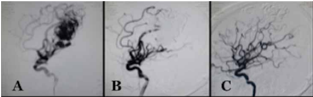
Figura 1. Panangiografía cerebral. (A) Panangiografía cerebral en eje carotideo, observando MAV cerebral con nido plexiforme. (B) Se observa embolización al 100% de MAV. (C) Panangiografía cerebral postquirúrgica, en donde se observa residual de cohesivo onyx hacia venas de drenaje, sin presencia de nido malformativo.