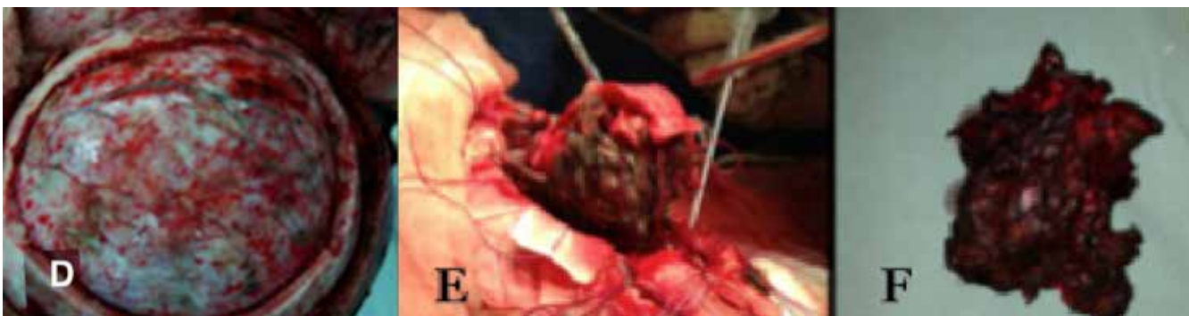
Figura 2. Fotografías transquirúrgicas, observando (D) la duramadre con vasos meningeos que presentan material cohesivo onyx. (E,F) se observa procedimiento quirúrgico en donde se representa resección de nido malformativo de consistencia pétrea.