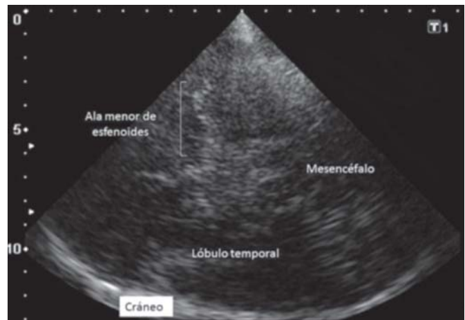
Figura 1. Detalles anatómicos del plano mesencefálico.

El DTCC fue realizado por el autor, con entrenamiento previo en la identificación y medición del sistema ventricular, y después de un año de experiencia, ciego al resultado de la TC. Se empleó un equipo Toshiba Nemio XG dotado de un transductor sectorial de 2.5 mHz, obteniéndose las imágenes en modo B. Con el enfermo en decúbito supino, se colocó la sonda en la ventana temporal preauricular con dirección orbitomeatal, por encima del arco cigomático y a una profundidad de imagen entre 14-16 cm, de manera que fuese posible identificar el hueso temporal contralateral. En ese plano, horizontal, se identificó primero la imagen hipoecogénica del mesencéfalo rodeada por el líquido cefalorraquídeo (hiperecoico) (Figura 1). Descendiendo algo en altura el transductor e inclinándolo aproximadamente 10 grados en