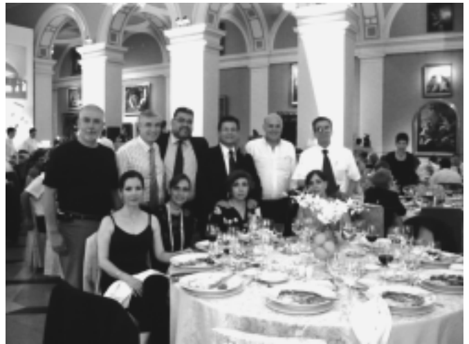
Figura 4. No todo fue ciencia... también en los eventos sociales, la pasamos muy bien...