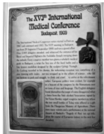
Figura 2. Primer Congreso celebrado en Budapest en 1909, pasando a través de los años por muchos problemas: las Guerras Mundiales, la falta de desarrollo, la falta de entendimiento, salvando todos los obstáculos hasta llegar a ser la organización que es hoy, con Ligas locales y Regionales, prácticamente en todo el mundo.