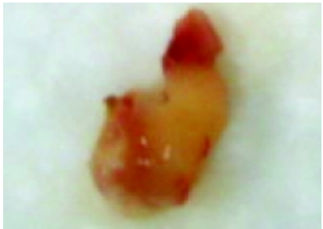
Figura 2. Especimen en su aspecto macroscópico de la lesión suprasillar, diámetro aproximado de 1.5 cm 3 .

Se realizó intervención quirúrgica en dos ocasiones para toma de biopsia y resección de la lesión suprasillar hipotalámica, con diagnóstico presuntivo de hamartoma del hipotálamo. Se obtuvo espécimen